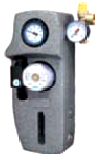
GRUPE MIXTE MONOTUBE - POMPE WILO MANOMETRE/THERMOM. VALVE SURPRESSION AVEC DEGAZEUR