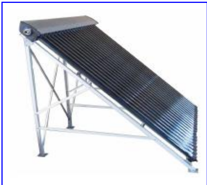
CHASSIS (ALUMINIUM) MOD 20R 20 TUBES

www.bachsoleil.com - bach@bachsoleil.com