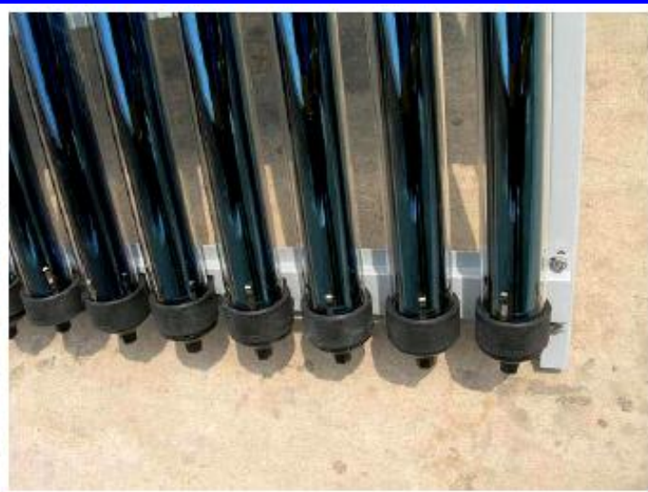
Capteur (aluminium) connecteurs laiton 1"