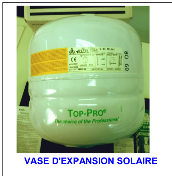
VASE D'EXPANSION SOLAIRE