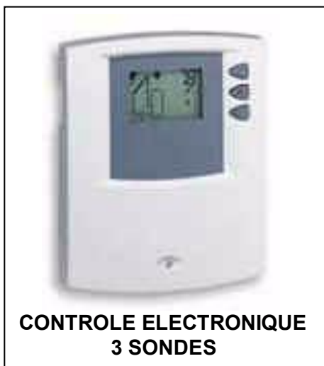
CONTROLE ELECTRONIQUE 3 SONDÉS