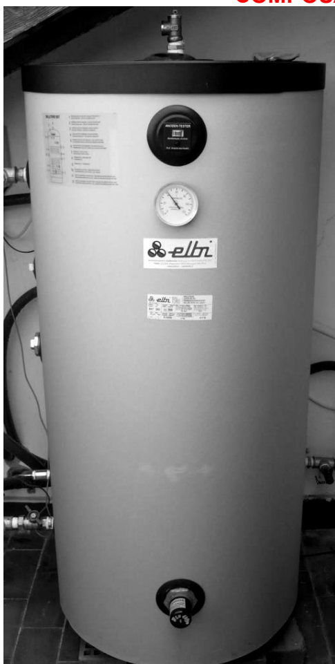
RESERVOIR ELBI BST 300LT