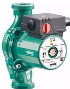
WILO STAR 100