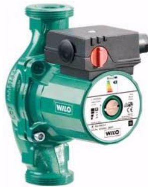
WILO STAR 100