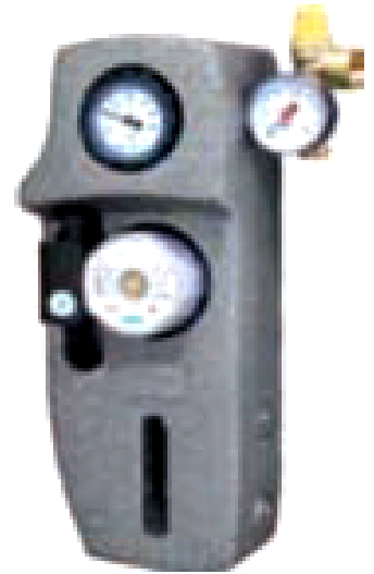
GRUPE MIXTE MONOTUBE - POMPE WILO MANOMETRE/THERMOM. VALVE SURPRESSION AVEC DEGAZEUR