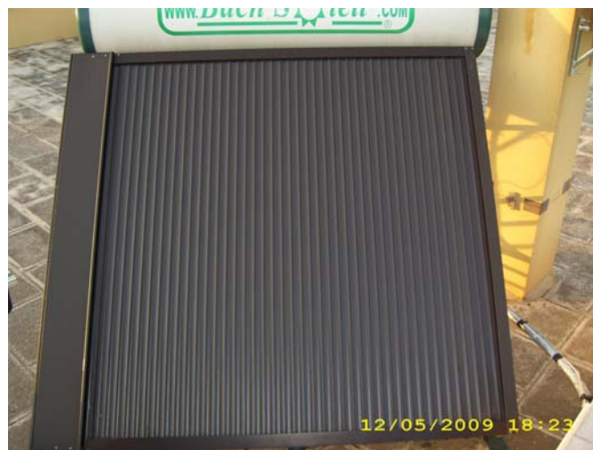
MODELLO COMPACT E/O NATURALE