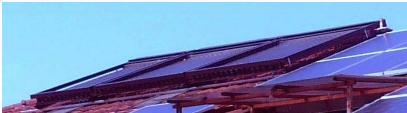
MODELLO A PROTEZIONE IMPIANTO A CIRCOLAZIONE FORZATA

Il particolare sistema di trascinamento permette alla tapparella di funzionare con qualsiasi inclinazione, sia su tetto inclinato che su superfici piane